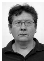
Zoran Danilović, Tanjug

K ada pokušavam da opišem trenutno stanje u srpskoj ekonomiji, prvo što mi pada na pamet je da smo skoro svi zaboravili na obećanja političara posle 5. oktobra 2000. godine koja se mogu sažeti u jednoglasnim nagoveštajima da će nam uskoro biti bolje i da ćemo brzo dostići 1989. godinu. Svi se sećamo šta je bilo i kako smo brzo napredovali do 2008. godine. Slažem se da smo krenuli sa niske startne osnove, gotovo sa nule, ali napredak je bio očigledan.