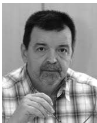
Zoran Luković, Blic

D eficit budžeta je na kraju maja pokazao gotovo tri puta veći minus od usvojenog, a da opet niko neće odgovarati za kršenje Zakona o budžetu. Doduše, hipotetički jeste moguće da do kraja godine iz državne kase bude mesečno trošeno koliko je dnevno para isplaćivano do sada, pa bi onda pitanje kršenja zakona i odgovornosti bilo izlišno. Ali, ko još u to veruje? Do kraja ove godine država mora da pozajmi više od dve milijarde evra da bi vratila glavnici i kamate po osnovu ranijih kredita. Ako se ne stegnu troškovi, a do sada je novac praktič-