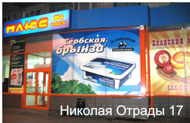
Николая Отрады 17