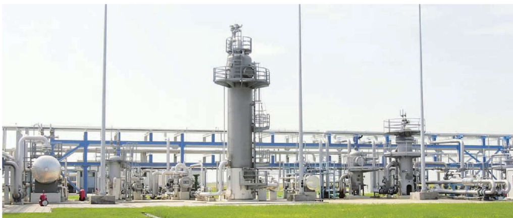
Фото 3: Анастасијевић