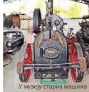
У музеју старих машина