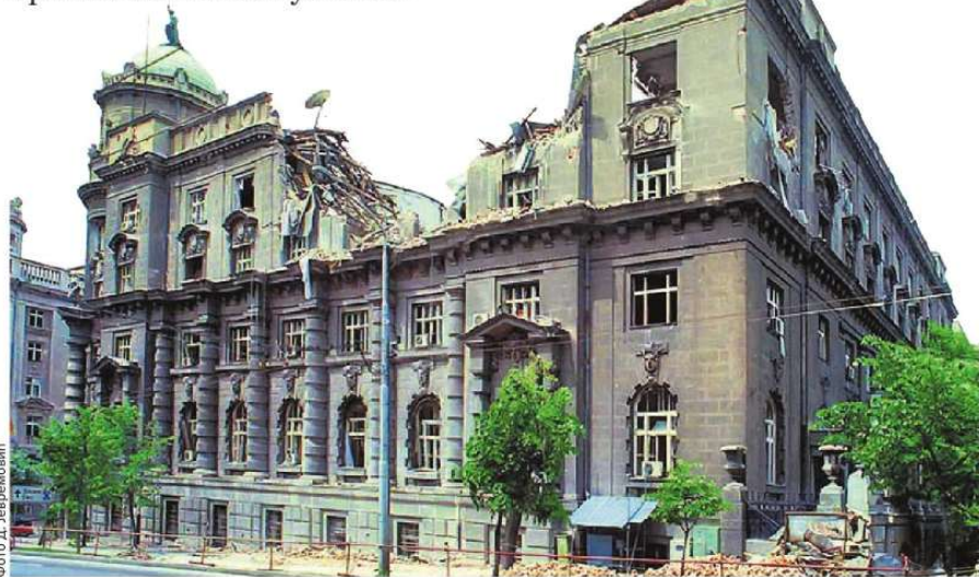
Зграда Владе Србије после НАТО бомбардовања 1999. године

Побеђена држава плаћа штету држави победници, али искуство из Првог и Другог светског рата показује да је Србија, иако победница, прошла као тешки губитник