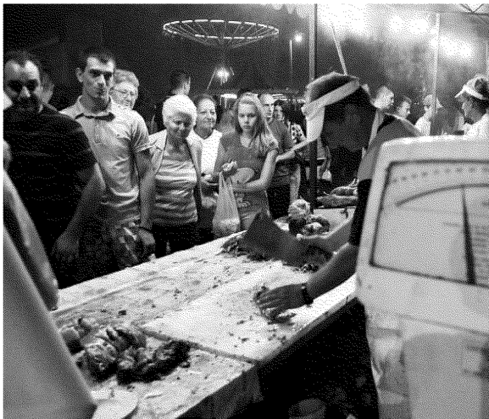
МЛАДЕНОВАЦ 2012: ПОГЛЕД НА РАСПОДЕЛУ БОГАТСТВА