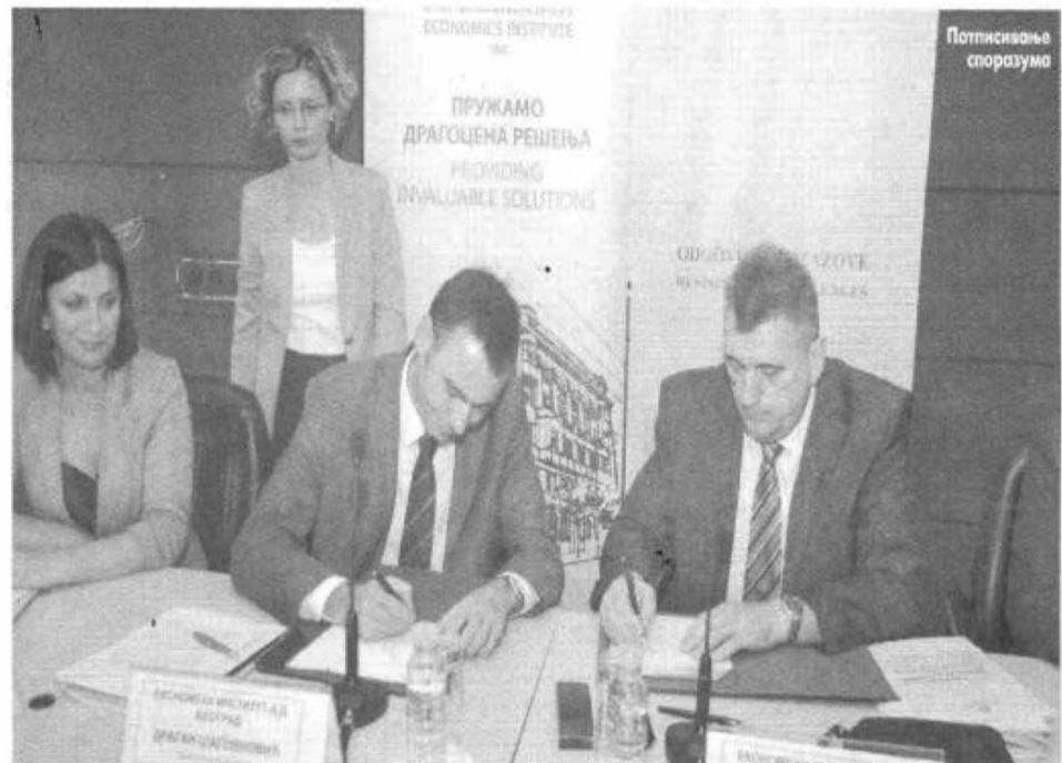
Потписивање споразума

Један од најважнијих пројеката сарадње Србије и РС стратешко повезивање електропривреда Србије и РС, поручио Шаговновић. Овај споразум ће допринијети конкретним корацима економске сарадње РС и Србије на терену у погледу развоја привреде и друштва у цјелини, истакао Комић