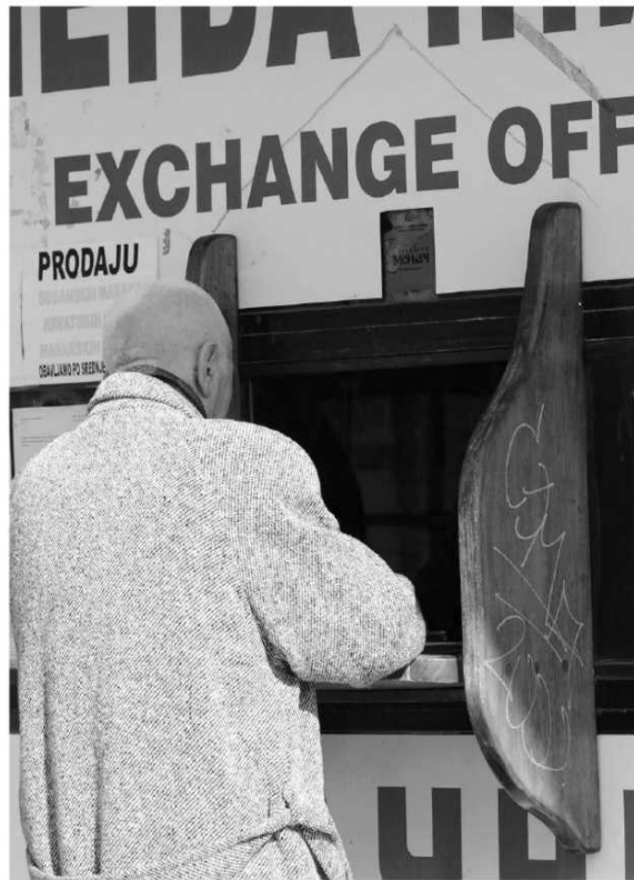
Kurs dinara za sada najočiglednija žrtva političke neizvesnosti

- Još kada je MMF zamrzao pregovore sa Srbijom, mi smo prognozirali da će pri rastu BDP-a od 0,5 odsto ove godine, dinar