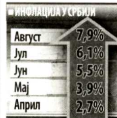
*Међугодишња стопа месец 2012/за исти месец 2011.

Према пројекцији НБС, пројектована инфлација за 2012. годину износила је 4,5 плус-минус 1,5 одсто. Извршни одбор Народне банке Србије одлучио је јуче да повећа референтну каматну стопу са