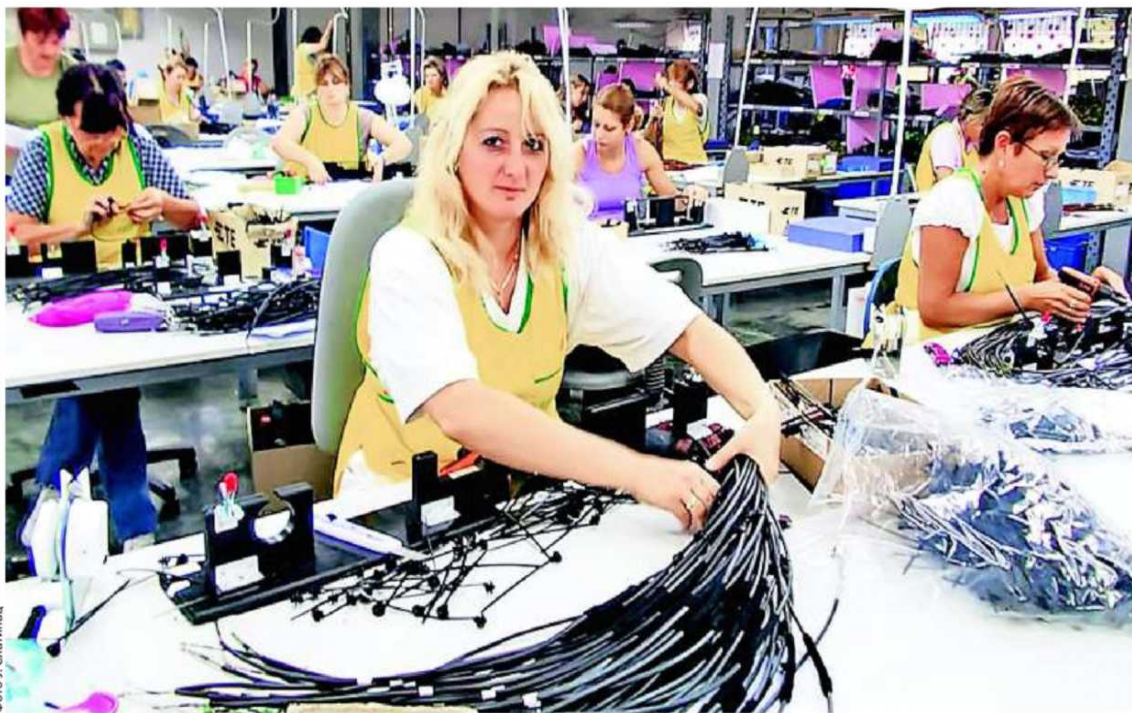
Опоравак привреде није могућ без нових радних места

Наредне године најкритичније су јавне финансије и одрживост јавног и укупног спољног дуга, јер ће годишње рате за кредите односити и 40 одсто вредности извоза