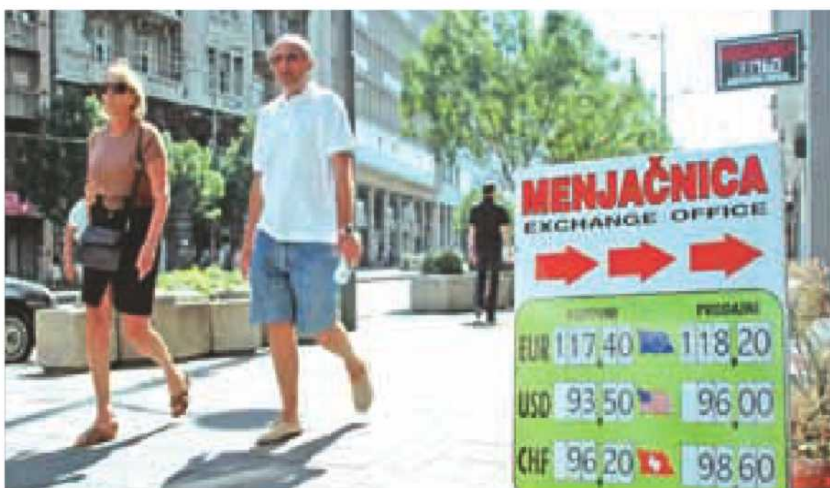
Anketa MAT-a među privrednicima pokazuje njihov jak pesimizam

- Planirani minus konsolidovanog budžeta je predviđen u iznosu od 150 milijardi. Fiskalni savet je rekao da će biti 200, ministar Dinkić pominje cifru od 225 milijar-