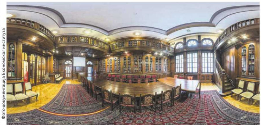
Библиотека легендарног Николе Пашића у Економском институту