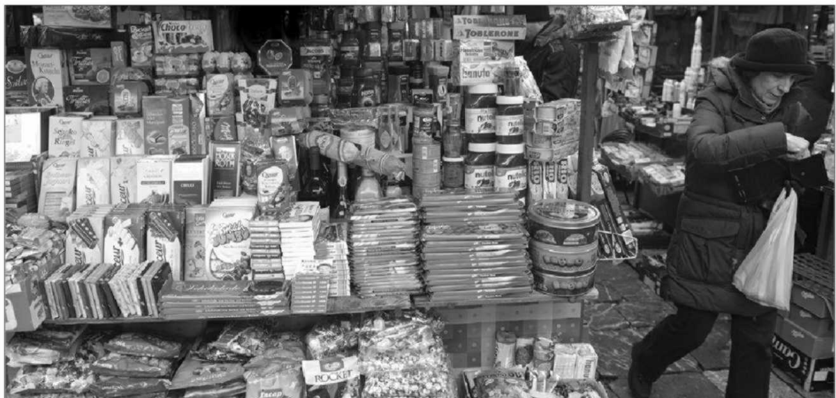
ИЗБОР На тезгама слаткиши, сухомеснате прерађевине, средстава за хигијену...

Груба рачуница штеће је око две милијарде евра, довољно да се покрије прошлогодњи „минус“